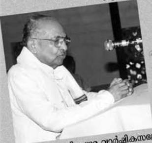
ശ്രീ. കെ.എം. ചാണ്ടി പ്രഥമ വാർഷികസമ്മേളനം ഉദ്ഘാടനം ചെയ്യുന്നു.